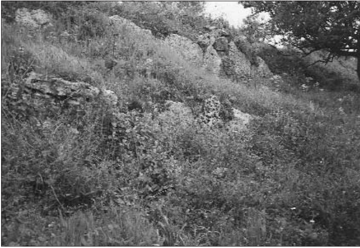
Οχύρωση: διπλά πολυγωνικά τείχη στο Παλιοχώρι του Μαρτίνου

Ήταν μια ηλιόλουστη αλκυονίδα ημέρα και καθώς περπατούσα εκεί στα κοκκινοχώματα στον Αϊ Γιώργη στο Παλιοχώρι του Μαρτίνου έπεσα επάνω σε κάποια λίθινα, αρχαία αντικείμενα, μικρής υλικής αξίας αλλά μεγάλης για εμάς και την ιστορική κληρονομιά του Μαρτίνου. Ενώ έχασα το πρωινό κυνήγι άρχισα την περιήγηση σε όλο το πλάτωμα του λόφου και αυτά που είδα με συνεπήραν. Διά-