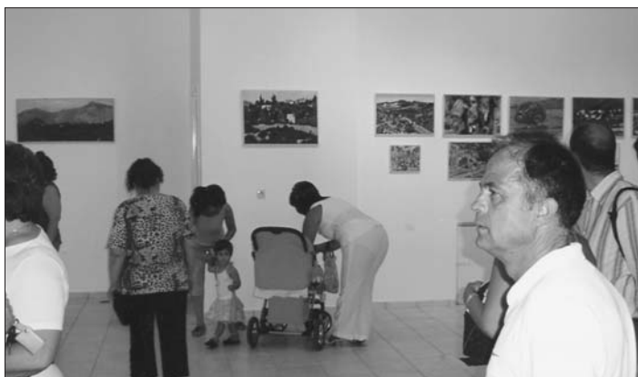
Στιγμιότυπο από την έκθεση.

Το ζωγραφικό έργο είναι σαν ένα δημιούργημα μνήμης που αποσπάται απ' τον χωροχρόνο και γίνεται κομμάτι αναμνηστικό