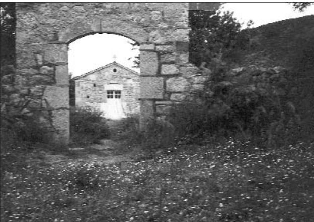
Ναός του Αγ. Γεωργίου στο Παλιοχώρι του Μαρτίνου.

9. Ζωντανό Video από το Παλιοχώρι Μαρτίνου.