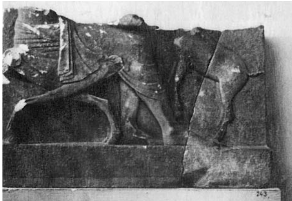
Επιτύμβια στήλη από το Παλιοχώρι Μαρτίνου σώζεται μόνο το κάτω μέρος ανδρικής μορφής που χαϊδεύει μικρό ελάφι. Μουσείο Θήβας.

Αυτά λοιπόν τα πιθανά αίτια θα αναφέρουμε εμείς σήμερα γυρίζοντας 2.500 χρόνια πίσω στα χρόνια των αρχαίων προγόνων μας και στις ασχολίες των κατοίκων των Λοκρικών πόλεων της περιοχής μας που είναι