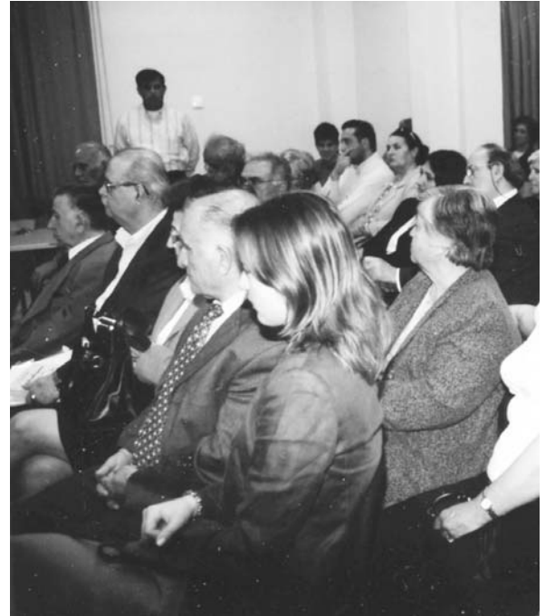
Στιγμιότυπο από το Φιλολογικό μνημόσυνο σ