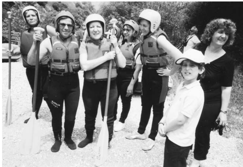
Οι δυναμικές κυρίες της εκδρομής

Μονοήμερη εκδρομή στον Εύηνο διοργάνωσε ο Μορφωτικός Σύλλογος Μαρτίνου στις 27/5/2007 με πολύ μεγάλη συμμετοχή.